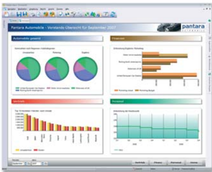
Dashboard mit grafisch dargestellten Kennzahlen aus unterschiedlichen Unternehmensbereichen.

In Kombination mit dem ETL-Tool Cubeware Importer und dem BI-Frontend Cubeware Cockpit V6pro bauen Sie mit der Cubeware Connectivity for SAP® Solutions einfach und schnell eine hochflexible, performante Business Intelligence-Lösung mit Ihren SAP-Daten als Datenquelle auf.